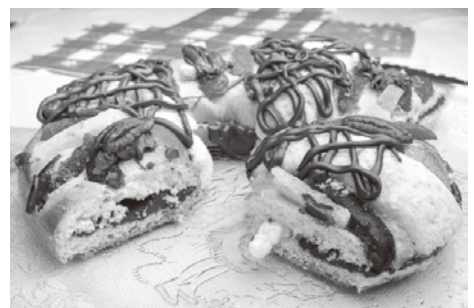
This is a sweet bread called "Rosca de Reyes". ▲

とでみんなに料理を振舞うことになりますが、幸運が訪れると言われています。昔はプラスチック製の固い人形が入っていましたが、最近では、砂糖やチョコレートで作られたものも使われていて、メキシコでも食の安全に気を使われるようになっていることが実感できます。