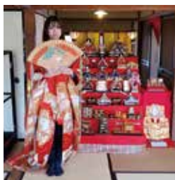
おひなさまと記念撮影！▶