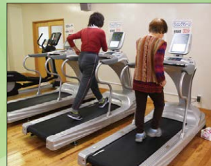
▲市体育館トレーニングマシン整備（3,400 千円）

これらの事業のほかに、スポーツキャンプのまちづくり事業やふるさとの文化と子どもを守り育てる事業などに、総額 38,175 千円を活用させていただきました。