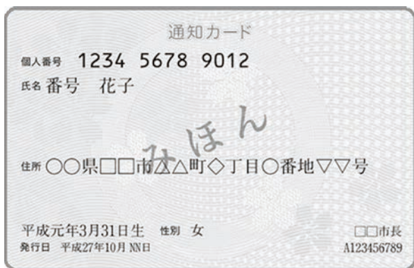
▲廃止された通知カード見本（緑色）

廃止となる通知カードは「紙製のカード」です。通知カードは廃止されますが、マイナンバーカードの交付申請時に必要ですので、紛失しないように大事に保管してください。