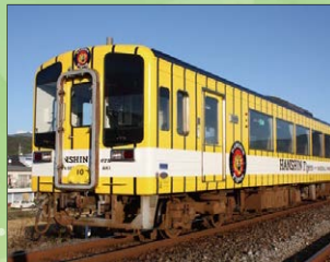
▲ごめん・なはり線タイガース列車の外装更新（4,140 千円）