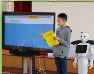
▲小中学校の情報教育環境の整備（電子黒板・プログラミング）（うち 7,550 千円）