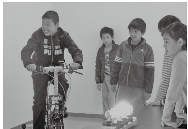
▲妙見山での環境学習の様子

エネルギー環境学習を地元の児童・生徒をはじめ、地域住民を対象に実施していただいています。