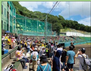
▲ウエスタンリーグ公式戦開催補助（2,160 千円）